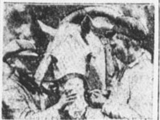
За работой в еврейской земледельческой колонии.