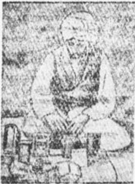
Хорокский купец со своим «товаром».

На посту нас встречают тепло. Отводят лучшее место для лагеря и без долгих разговоров зачислят на довольствие. Раскладывая свой скарб на привычные места, мы в первый раз