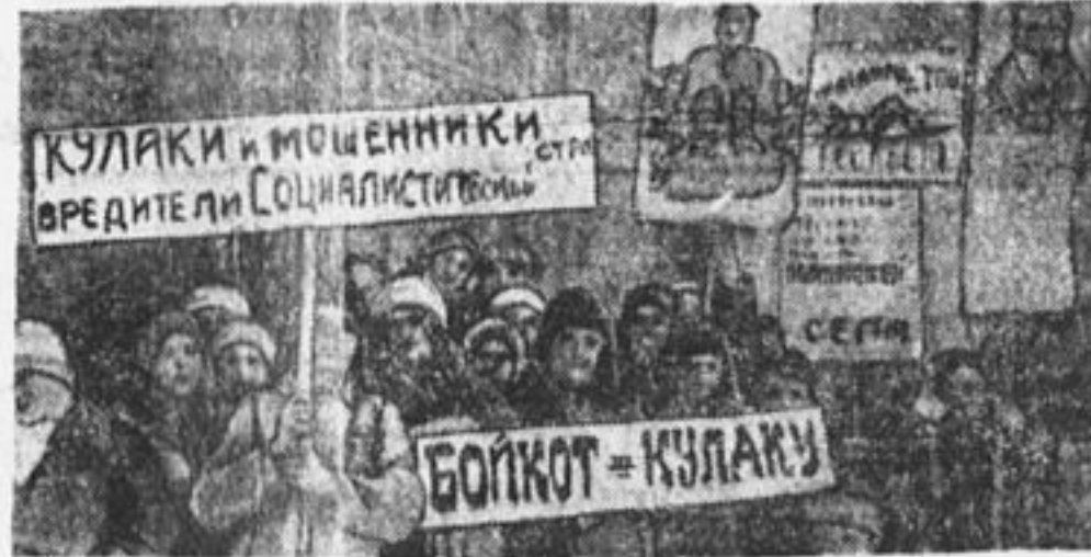
Демонстрация школьников и пионеров против кулаков, не продающих государству хлеба.

Таким образом, помещики и кулаки выбрасывали на рынок около 15 миллионов тонн хлеба, почти в два с половиною раза больше, чем основная масса крестьянства. Объясняется это тем, что кулаки и помещики владели крупными хозяйствами. Преимущество таких хозяйств перед мелкими заключается в том, что они имеют возможность применять машины, химические удобрения, достижения науки и