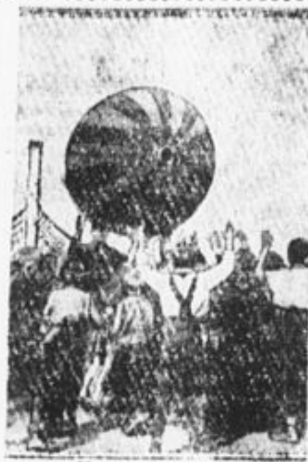
Игра в пушбол.

Французам ее называют «Положить кисть на лопатки». Двое играющих ставят локти правой руки на стол, скамейку или на свои собственные колени. Обхватывают друг у друга ладони большими пальцами и стараются отвести руку противника. Играют в нее даже в поезде. Руки скоро делаются сильными, но, конечно, играть следует поочередно: то правой, то левой рукой.