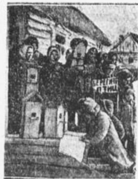
Деревенские ребята готовятся к приему пернатых гостей.