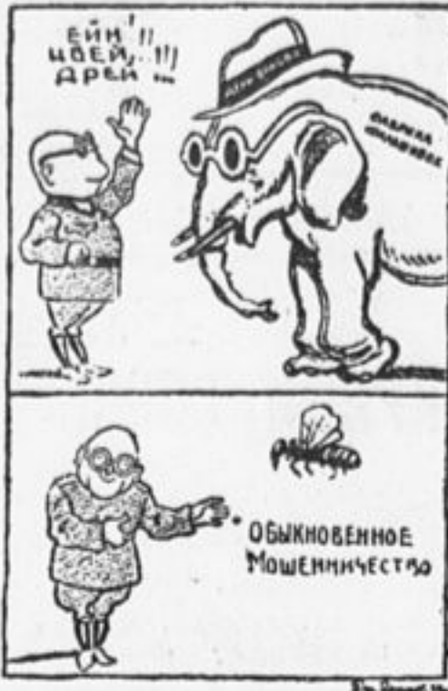
Без чудес, единым духом, ловкость рук видна одна! То слона родит из мухи, потом муху из слона!